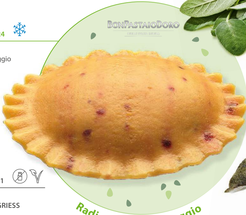
Radicchio küsst Taleggio

TK GRANSOLE gefüllt mit Taleggio und Radicchio 2 kg / Karton Bon Pastaio | Deutschland