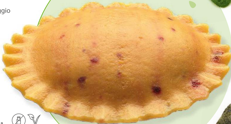
Radicchio küsst Taleggio

TK GRANSOLE gefüllt mit Taleggio und Radicchio 2 kg / Karton Bon Pastaio | Deutschland